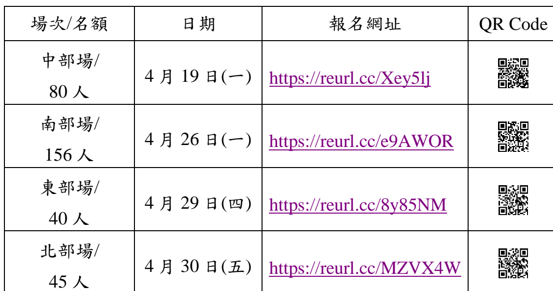
表二 各場次報名網址