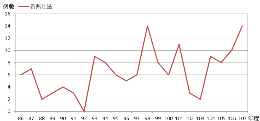
圖 2：基隆市歷年社造點新興社區數量變化圖

由表 4 及圖 2 顯示，自 93 年起新社區參與數量開始成長，至 98 年達到高