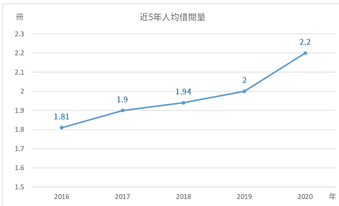
圖 2 近五年人均借閱量