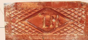
台灣煉瓦株式會社 (Taiwan Renga) 所產製的高品質 紅磚。

此外，台所及風呂原先還有兩處以紅磚所打造的柴火爐、煙囪，這部分已還原至原貌，當時所使用的紅磚為台灣煉瓦株式會社(Taiwan Renga)所產製的高品質紅磚，細看這些紅磚上刻有T.R.字樣，在這裡補充一個小知識，1930年之前台灣煉瓦株式會社所生產的紅磚，其T.R.為陰刻，之後產的T.R.為陽刻。