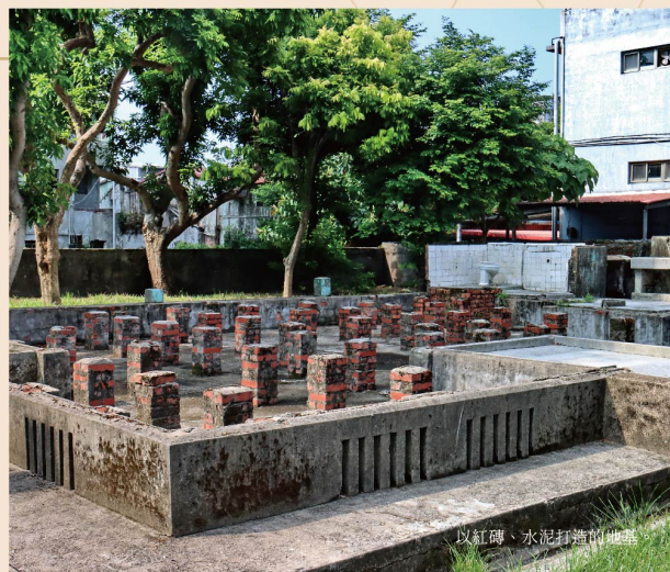
以紅磚、水泥打造的基礎