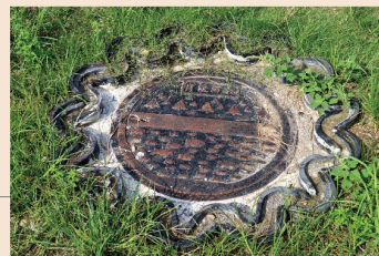
人孔蓋四周以老房子取 下來的屋瓦做裝飾。

局，即可連通的起居室、茶室。推開起居室、茶室的手推門，便可欣賞戶外的庭園綠意，昔日更可遠眺大沙灣海水浴場。校官眷舍內還規劃了校官住的和式房間以及傭人房、浴室、廚房等。