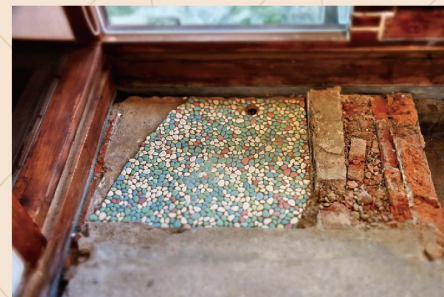
碎花磚鋪設地 面的洗浴處。