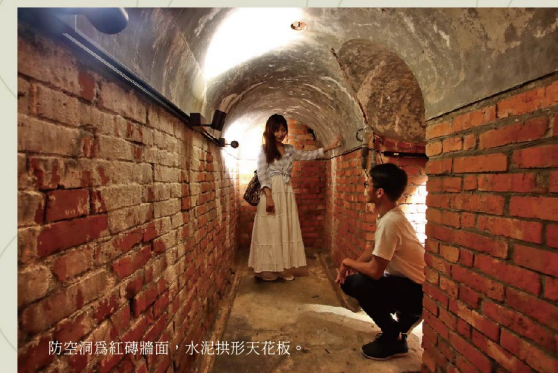
防空洞為紅磚牆面，水泥拱形天花板。

防空洞以紅磚疊砌牆面，並以水泥鋪平圓拱形的天花板，地面上還設置有排水道，雖然只是簡易的避難場所，但內部規劃得毫不馬虎，防空洞經整修後，以投射燈照明內部，走進帶點幽暗、神秘的這處小空間，別有一番探險意味。